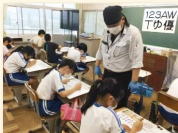
① 小学生の表札作り体験 （広告美術仕上げ職種）

「小中学校などの児童・生徒」や、「地域若者サポートステーションの支援対象となる方」へ、「ものづくりの魅力」を伝えます。体験することでものづくりへの興味を喚起し、マイスターの製作実演や講話で、マイスターの仕事や、体験した技能が仕事の中でどう活かされているかなどを学びます。